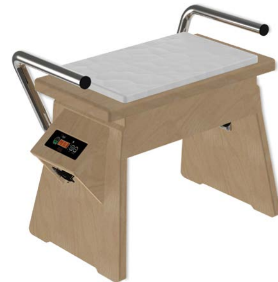
Galileo Med Chair