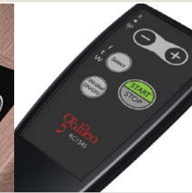
Wobbel-Fernbedienung Nähere Informationen ab Seite 44.